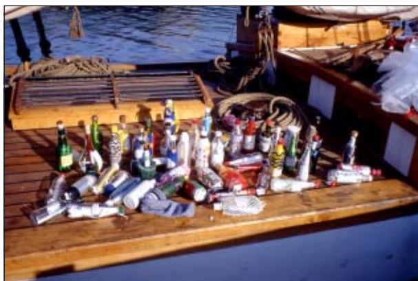
Barnen skickar flaskpost med Vega af Bergkvara.

En ny dramaturgi arbetas fram som utgår ifrån att vi alla är kaptener på vår egen skuta. Hur kan vi förena det som är viktigt för dig med det som är viktigt för mig? Gestaltningen av det första Framtidsskeppet tar form och visualiseras.