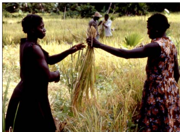
Risskörd vid Atratofloden, Chocó, Colombia. Från Globögats film "Se siembra el Cambio".