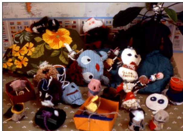
Globfotingarna är fantasivarelser med meddelanden och gömda frön.

Globfotingar är fantasivarelser som barn skapar, med viktiga meddelanden och ett frö som finurligt gömms någonstans. Idén föds på Ekensbergsskolan i Gröndal, Stockholm. Globfotingar delas ut till delegater vid internationella konferenser med en uppmaning att plantera fröet och svara på barnens budskap.