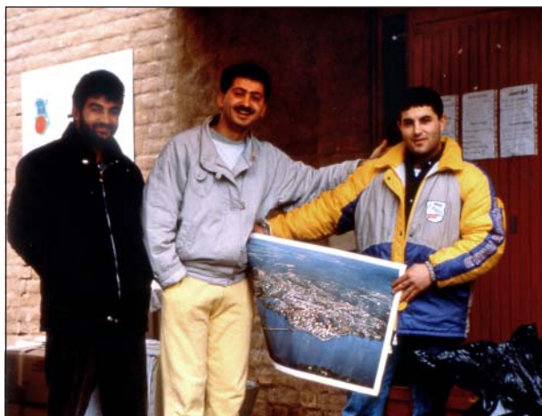
Mötesplats Strängnäs, Flyktingsslussen, Sundby Park, 1988

“En kommun möter rasism och främlingsfientlighet - Mötesplats Strängnäs”. Strängnäs kommun engagerar Globträdet i ett projekt som pågår under ett helt läsår – hösten 88 och våren 89. I projektet deltar alla förskolor och grundskolor i Strängnäs kommun. Globträdet bor på flyktingförläggningen Sundby Park och arbetar i nära samarbete med de asylsökande. Globteaterns föreställningar ses av samtliga elever, lärare och föräldrar. Seminarier och uppföljande workshops har temat Våga vandra över bron!