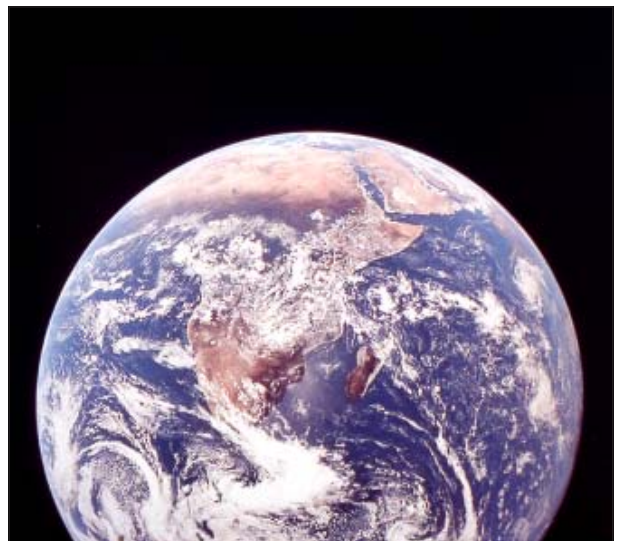
Jorden sedd från astronauternas perspektiv.