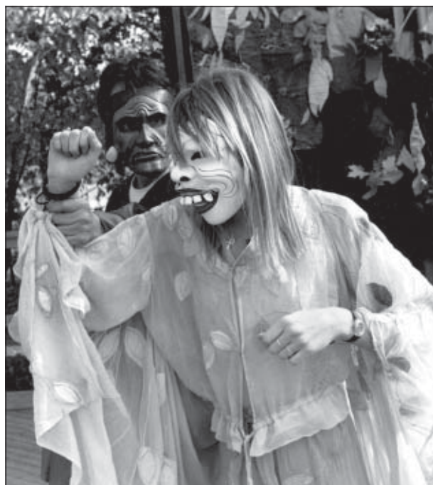
Möt din mask! Balinesiska masker används här i en föreställning på Skansen under UNESCO-dagen 1989.