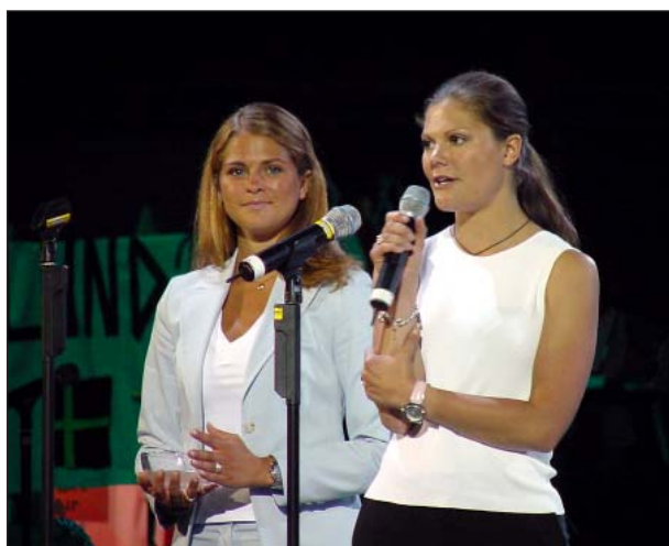
Kronprinsessan Victoria och Prinsessan Madeleine fick ta emot Vårt förenande vatten på Grande Finale i Globen.

Workshop för erfarenhetsutbyte arrangeras för projektledare och andra vuxna som deltar i Framtidsskeppet.