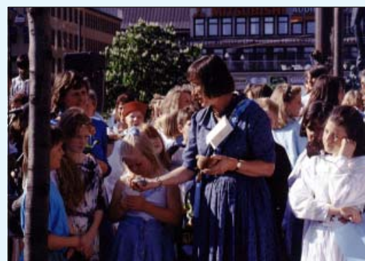
Miljöminister Birgitta Dahl håller en skål med Vårt förenande vatten vid Framtidsträdet på Hötorget i Stockholm, 1990

Uppföljande workshop i Älvkarleby där barn/ungdomar och vuxna med olika yrkesbakgrund arbetar fram ett vattenprogram: Blue Planet Curriculum .