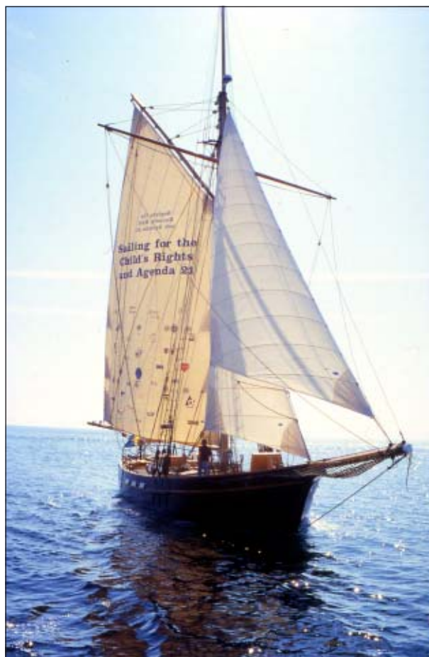
Vega af Bergkvara på väg ut i världen.