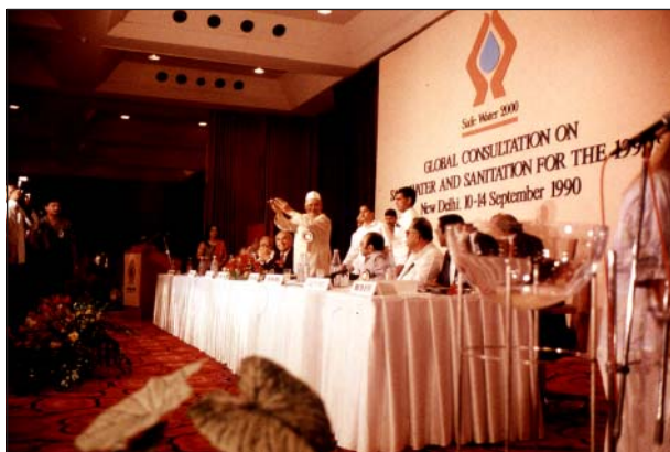
Vattenceremoni på Safe Water 2000 i New Dehli, Indien

UNDP (United Nations Development Program) organiserar konferensen "Safe Water 2000" i New Delhi, Indien, som öppnas med Our Uniting Water Ceremony. Vatten från fem kontinenter förenas. Det indiska vattnet hämtas från Ganges källflöde i Himalaya.