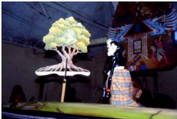
Globträdet möter Javanesisisk Wayang Golek på workshop i Bandung. Se föregående sida.