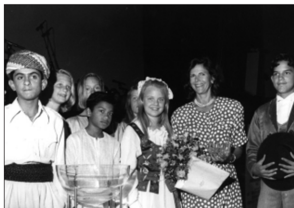
Drottning Silvia tar emot Vårt Förenande Vatten på Stockholm Water Symposium, 1991