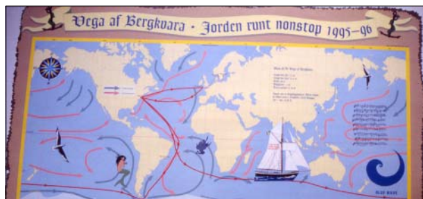
Barnens Budbärare skulle resa runt hela jorden.

Barnens Budbärare är en Ensamseglats med Vega af Bergkvara, som seglar för de båda FN-dokumenterna Barnets Rätt och Agenda 21. Idén är att sprida ökad kunskap om innehållet i de båda FN-dokumenterna. Förberedelserna påbörjades under 1993 med att rusta upp det gamla skeppet Vega af Bergkvara och samtidigt väcks tanken att man via satellitkommunikation skall kunna följa seglatsen jorden runt. Äventyret planeras som en global teaterföreställning med ensamsegelaren som huvudrollsinnehavare medan skeppet förflyttar sig fram i scenografin, som är alla världshaven. Ett stort studiematerial arbetas fram och som loggbok utformas en handgjord A4-pärm i trä, tillsammans med interner på Skänningeanstalten.