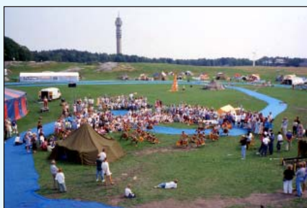
"Det blåa havet" över Gärdet. Till vänster ser man cirkustältet med scenen.