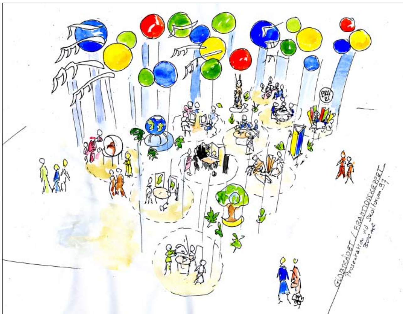
Utställningsskiss utformad av Ben van Bronckhorst inför Skolforum 97.