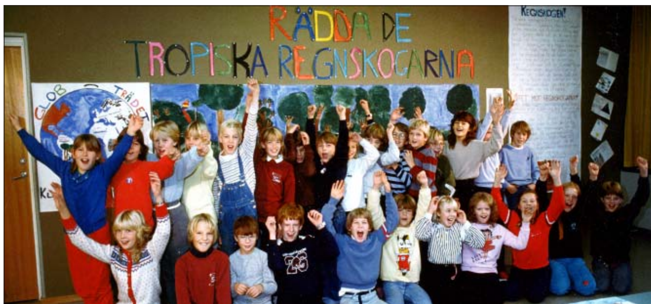
Fjärdeklassarna på Slagstaskolan i Eskilstuna framför sin egen utställning om de tropiska regnskogarna.