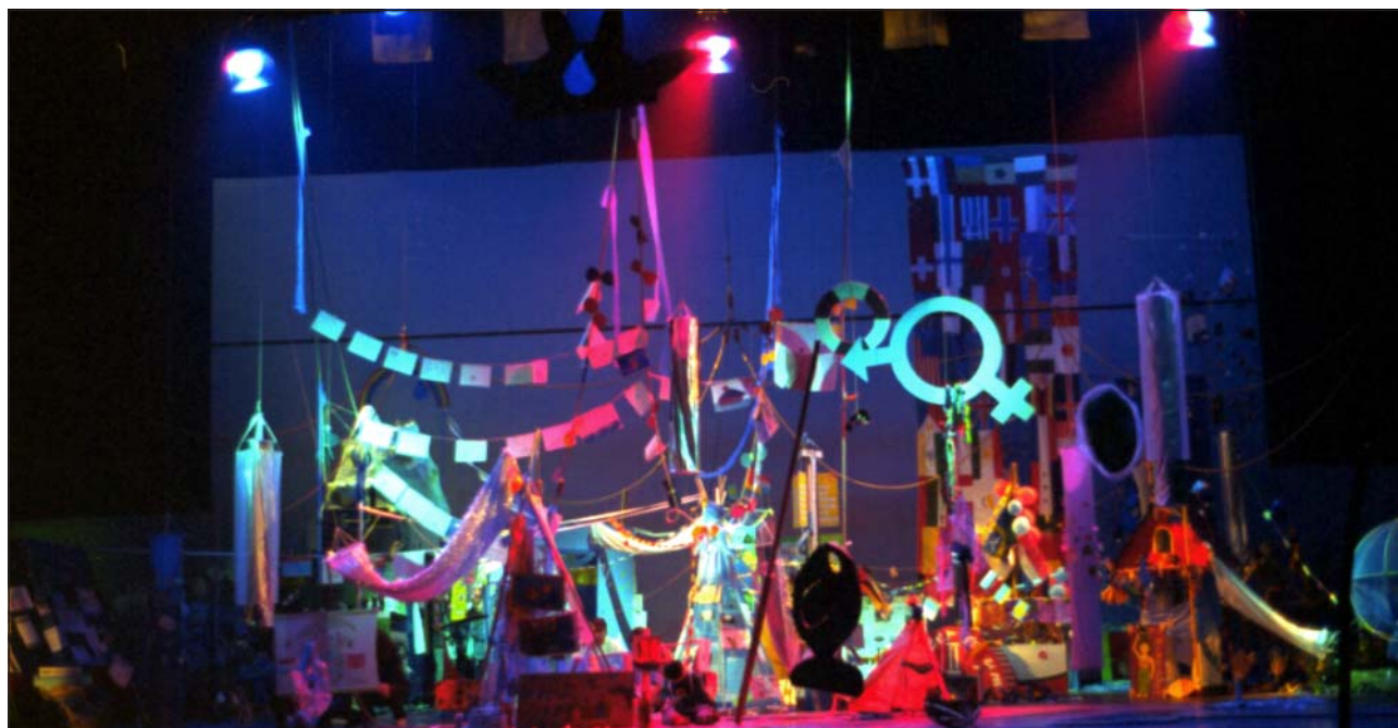
Framtidsskeppet i Haag, Nederländerna, byggdes på scenen, mitt i världskonferensen World Water Forum.