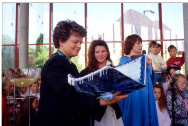
Norges Statsminister Gro Harlem Brundtland är hedersgäst vid Our Uniting Water Ceremony, 1990

Our Uniting Water Ceremony framförs av barn från två norska kommuner där Statsminister Gro Harlem Brundtland är barnens hedersgäst.