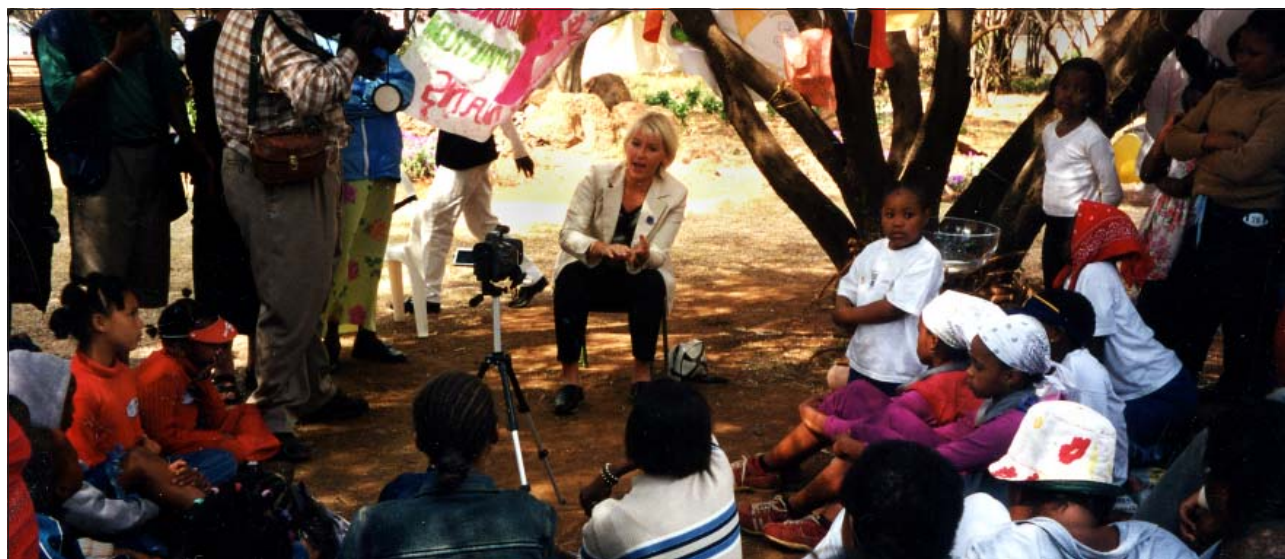
Margot Wallström möter barnen från Soweto på Världskonferensen om Hållbar utveckling i Johannesburg.