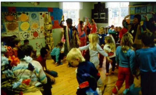
Föreställningen Dasa Namu Kartu i Fagersjöskolan, Sorrunda.