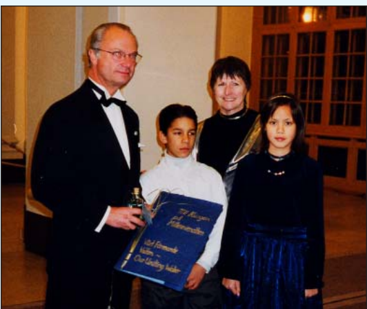
Kung Carl XVI Gustav tar emot Vårt Förenande Vatten, Millenienatten på Stockholms Slott.