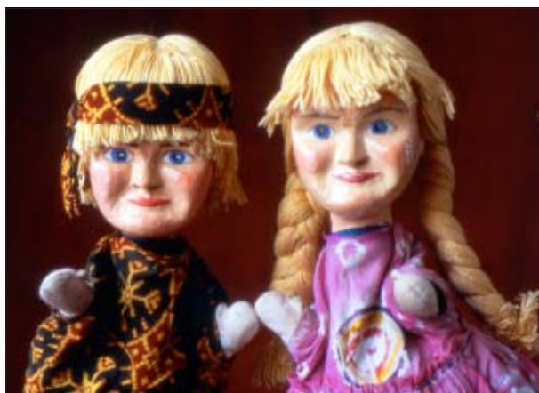
De två handdockorna Han och Hon söker svar på frågor från barnen - Har vi någon framtid?

Idén väcks att resa till regnskogen och utforska dess hemligheter tillsammans med två handdockor, en flicka och en pojke. Hon och Han blir den 8-åriga flickans budbärare: - Har vi någon framtid?